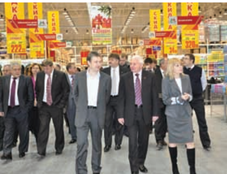
В торговом зале гипермаркета.

На первом этаже на площади 1000 кв. м владимирцам будут предоставляться различные услуги – от химчистки одежды и ремонта обуви до приобретения подарков и косметики. Там же расположены аптека, магазин оптики, салон связи и даже кинотеатр. В гипермаркете можно будет приобрести около 30000 наименований товаров по доступным ценам. Также будет представлен большой ассортимент готовых блюд и салатов собственного производства из качественных и свежих продуктов.