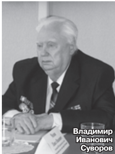
Владимир Иванович Суворов