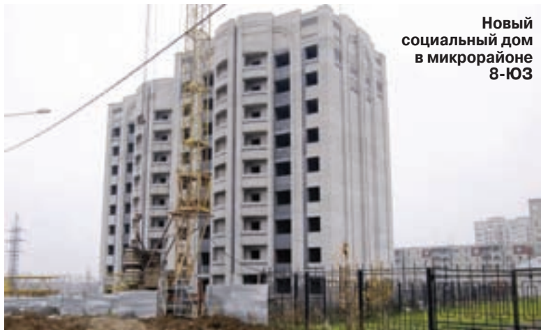
Новый социальный дом в микрорайоне 8-ЮЗ

– В нашу городскую администрацию часто приходят письма, где жители жалуются, что дворы